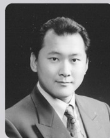
[クレオパトラ/カエル] 岡戸 淳