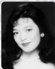
[歌姫ルビー] 歳野蘭子