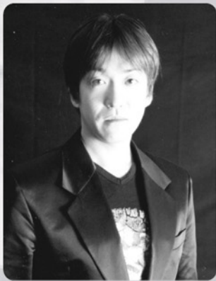
原作/脚本/作曲 神田慶一